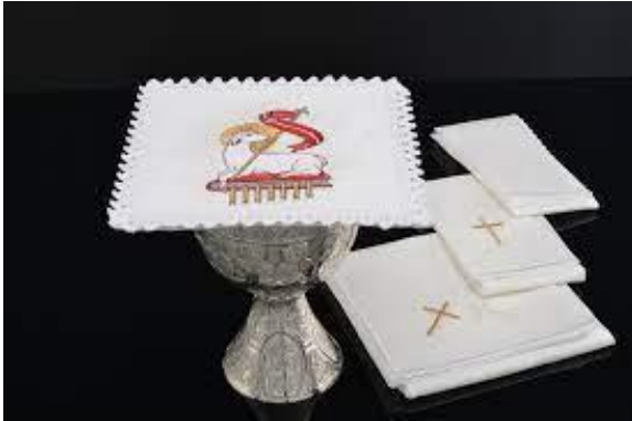
Pale placée sur le calice et les trois autres linges sur le côté.