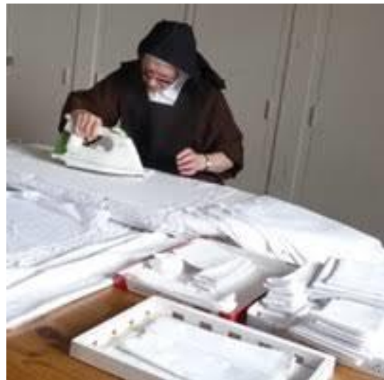
En plein travail de repassage