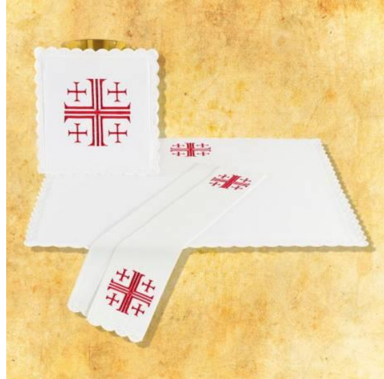
Brodés avec des croix de Jérusalem