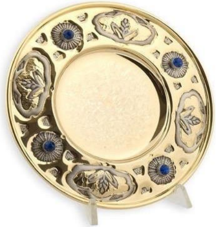
Patène ornée de petits épis de blé