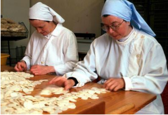
Religieuses au travail