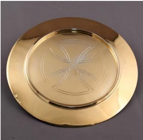
Cette patène est décorée par une jolie croix