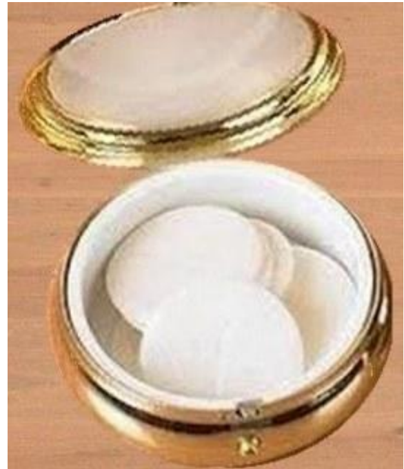
Petites hosties dans une custode, surtout pour la communion des malades