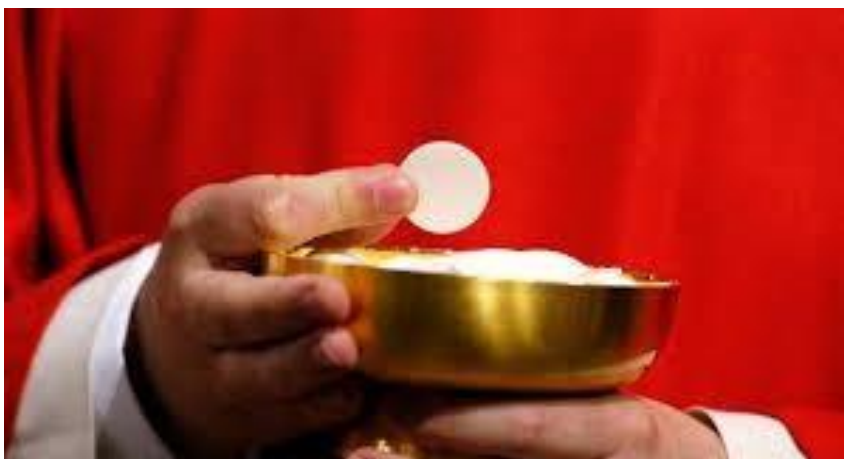
Le prêtre présente à la personne qui communie une hostie consacrée