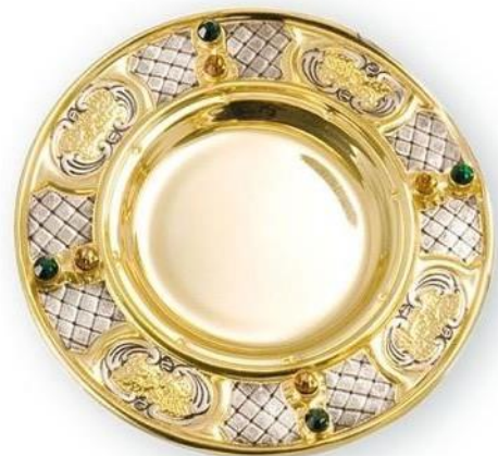
Cette patène aussi a été embellie par un orfèvre

Ces trois lettres sont un christogramme, autrement dit une abréviation du nom de Jésus en grec.