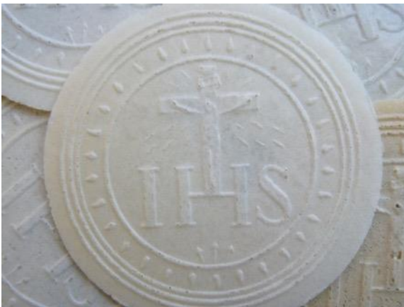
Grande hostie avec les lettres IHS (=Jésus Sauveur) et la Croix